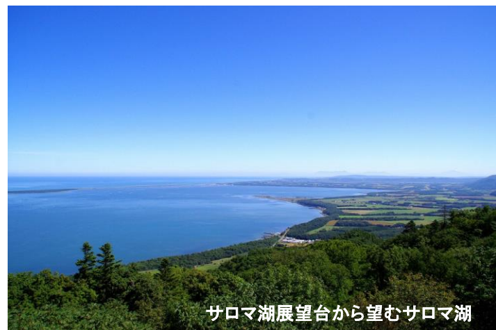
サロマ湖展望台から望むサロマ湖

〒093-0592 北海道常呂郡佐呂間町字永代町3番地の1 Tel 01587-2-1211 Fax 01587-2-3368 ◇公式ホームページ www.town.saroma.hokkaido.jp/ ◇公式フェイスブック 「佐呂間町～森と湖のまち～」