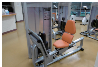
④レッグカール&エクステンション （腿の筋力運動）