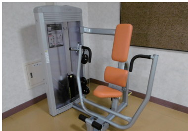
②フライ（胸の筋力運動）