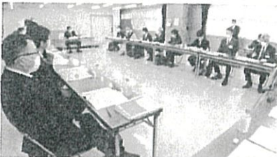
検討委員会では部活動の地域移行への課題を指摘する声が相次いだ=2022年11月8日、山形市