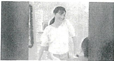
「すごい変わるよ」太った友達 が痩せたカーブス10回無料体験が...