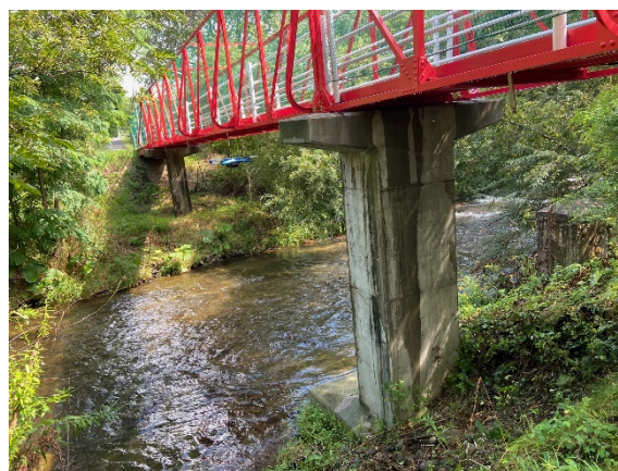
新技術（ドローン）による点検状況