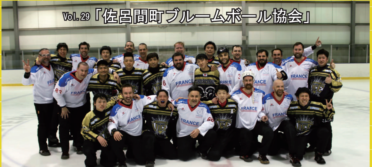
(2016 ワールドブルームボールチャンピオンシップ)