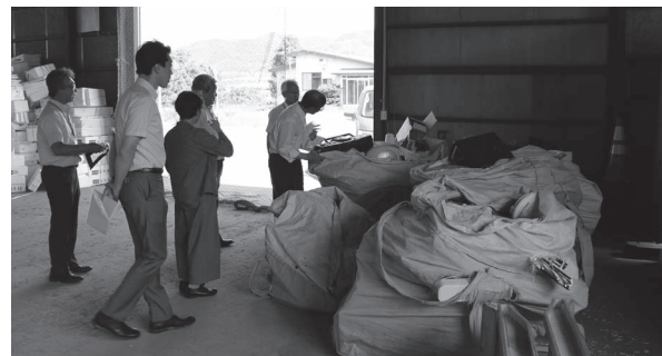
資源ごみを保管するストックヤード（写真は小型家電）

漁村環境改善総合センター 富武土地区住民の集会施設として利用されている建物で、昭和54年の建設から40年たち、全体的に老朽化していますが、これまでの改修によりまだ十分に使用可能な施設となっています。地域住民による有効活用を促進するため、本年7月1日付けで佐呂間漁業協同組合へ無償譲渡されます。