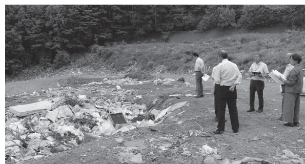
埋立できる限界が迫っている知来ゴミ処理場

若佐ストックヤード 元は木材工場の倉庫でしたが、町に譲渡され平成15年から回収した資源ごみを一時的に保管するストックヤードとして使用しています。回収された資源ごみはストックヤード内で種類ごとに分けて保管され、ここから湧別町にある遠軽地区広域組合のリサイクルセンターや、家電リサイクル業者へ運ばれていきます。