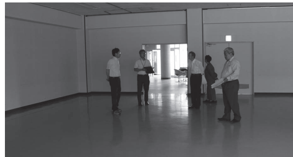
有効活用が期待される漁村環境改善総合センター

障がい児通所支援施設「めるくる」 北海道の監督員詰め所あとを改修して、平成25年8月に遠軽の社会福祉法人・北光福祉会の運営で開所しました。発達に心配のある児童生徒達と一緒に宿題や遊びに取り組み、さまざまな経験を積むことで、健やかに成長するよう