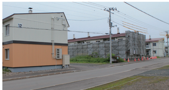
今年も引き続き改修工事が行われている西富団地