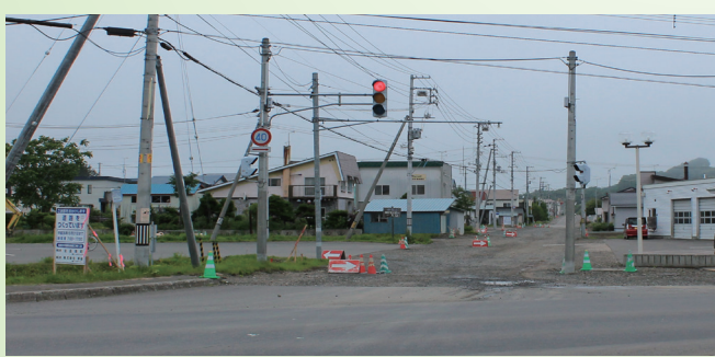
現在工事中の佐呂間30号道路

■公共事業の執行状況について 本年度、町が執行を計画しております主な工事と委託の事業件数は46件、総額6億7千万円を予定、発注状況については23件で2億9千9百万円で発注率は、件数50%、金額45%となっております。 各町道や公共施設などで改修工事を実施し、町民の皆様には何かとご不便をおかけいたしますが、ご協力の程お願いいたします。