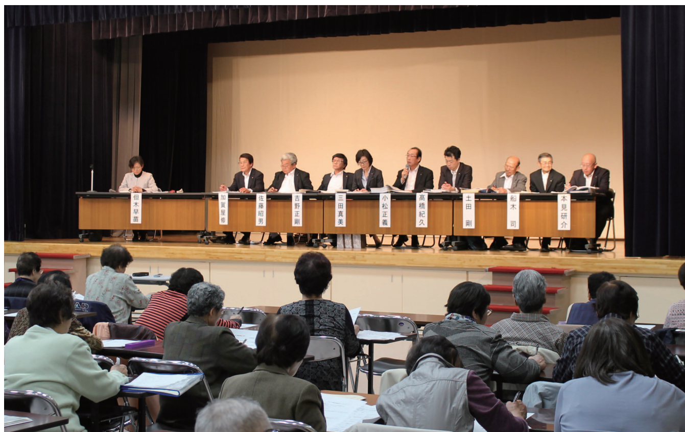
大先輩方を前に、いつもよりも緊張しています！ 寿大学議会懇談会 平成29年6月2日撮影